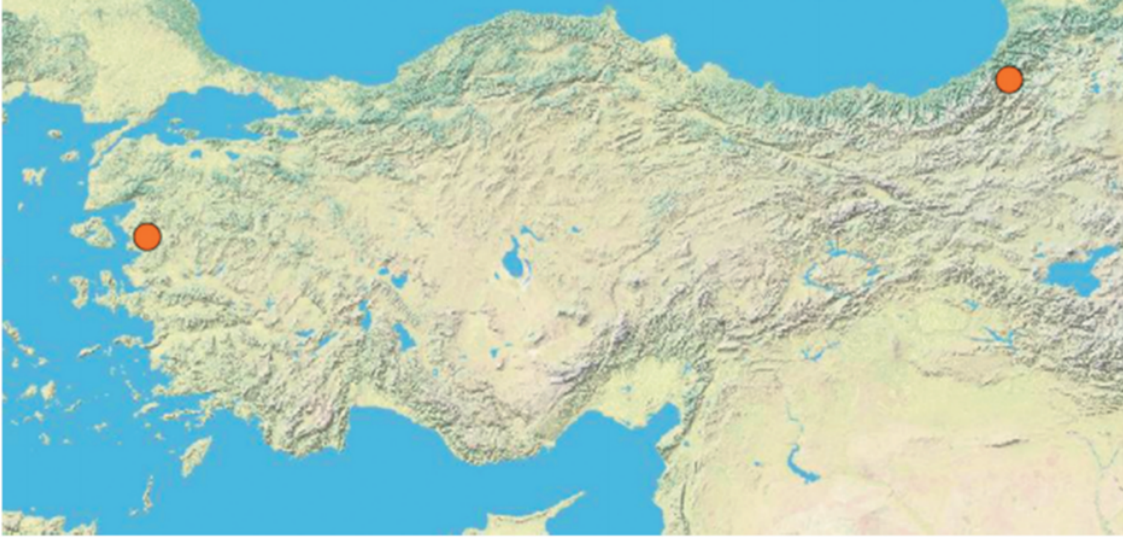
Grafik 2. Bergama ve Artvin-Cerattepe'nin konumu. (Soldaki daire Bergama'nın yerini, sağdaki daire Artvin-Cerattepe'ninkini göstermektedir).

edip tazminat talep etse de, çevresel bozulmadan sorumlu proje faaliyetini durdurmaz ( Cordella ve Diğerleri İtalya'ya karşı (2019), 7 Bursa Barosu Başkanlığı ve Diğerleri Türkiye'ye karşı (2018), 8 Fadeyeva Rusya'ya karşı (2005) 9 davalarında olduğu gibi). Sonuç olarak, mahkemeler gelecekteki olaylar için güçlü bir caydırıcılık sağlamaktan yoksun kalmaktadır. Bu, Taşkın ve Diğerleri Türkiye'ye karşı gibi davalarda para cezası veren, ancak kararları gelecekteki çevresel adaletsizlik davaları için güçlü bir caydırıcılıktan yoksun olan çok saygın uluslararası insan hakları mahkemesi AIHM'nin durumunda açıkça görülmektedir. Medeni mevzuatın ulusötesi şirketlere yönelik toplumsal taleplere yanıt verme konusundaki sınırlamaları (değişim kolaylığı, kapsayıcı olmama, yürütmeme, denetlememe gibi) göz önüne alındığında, çevresel vakalarda uzun vadeli adaleti sağlamak için dava açmanın etkinliğinin sorgulanması için acil bir ihtiyaç vardır. 10